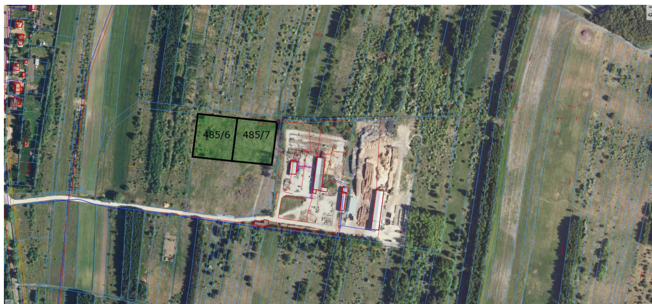
Chmielnik, działki ewidencyjne nr 485/6 i 485/7 obręb Chmielnik 01 – przeznaczone do sprzedaży