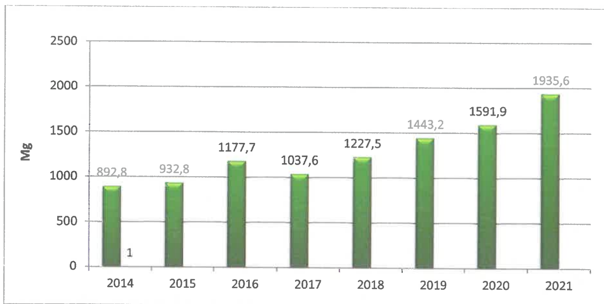
Wykres nr 2. Masa odebranych odpadów komunalnych od mieszkańców Miasta i Gminy Chmielnik w latach 2014-2021, opracowanie własne

Obserwuje się wzrost ilości odpadów komunalnych odbieranych od mieszkańców Gminy Chmielnik. W 2021 roku zebrano 1935,57 ton odpadów komunalnych, a więc o ok. 343,68 ton więcej niż w roku 2020. Na przestrzeni 8 ostatnich lat funkcjonowania systemu wzrosła ilość odpadów komunalnych odbieranych od mieszkańców o ok. 116,7 %. Wykres nr 2 obrazuje masę odebranych odpadów od mieszkańców (w tym odpadów zebranych w PSZOK-u) w latach 2014 – 2021. W wykresie pominięto dane za rok 2013, z uwagi na brak danych o ilości odpadów pochodzących od mieszkańców w I półroczu 2013r. w którym nie funkcjonował gminny system.