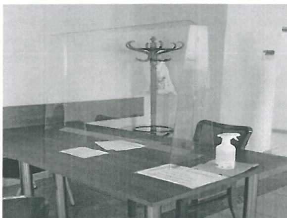
Miejsce obsługi interesantów

Po wejściu do budynku pracownik informacji kieruje interesanta do odpowiedniego pracownika. Spotkania z interesantami odbywają się w specjalnie przygotowanych pomieszczeniach. Pomieszczenia zostały doposażone w przegrody wykonane z pleksi (fotografia poniżej). Znajdują się w nich również preparaty do dezynfekcji rąk. Pracownik przyjmuje interesanta zabezpieczony w maseczkę ochronną/przyłbicę.